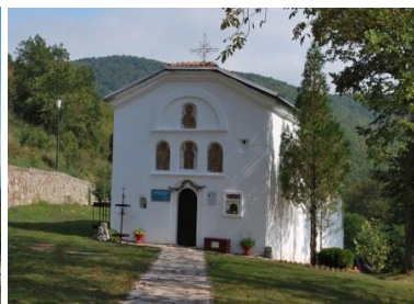
Manastir sv. Jovan